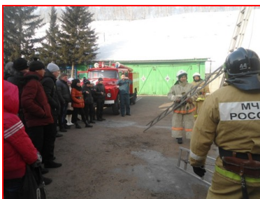
Профориентационная работа. Отделение ГПН по Боханскому и Осинскому районам Иркутской области. (9,10 классы)