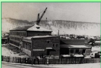
Строительство современного здания школы, 1972г.