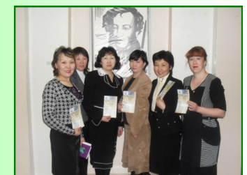
Творческая инициативная группа педагогов, участники региональной НПК