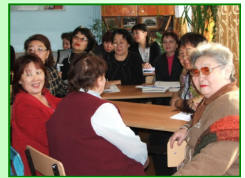
Педагоги—участники круглого стола, 2007г.