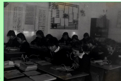
Урок английского языка в лингвфонном кабинете, 1984г.