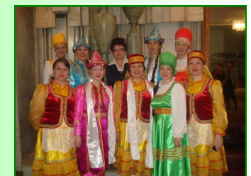
Хореографическая группа педагогов «Сердце матери», участники регионального смотра-конкурса художественной самодеятельности педагогических коллективов