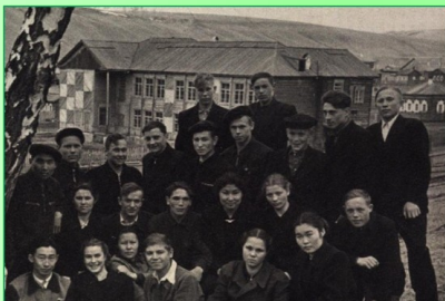
Учащиеся на фоне здания Боханской СШ, 50-е гг.

В 1958-1959 учебном году по стране было введено всеобщее семилетнее образование. В учебный план школы вводились новые учебные предметы: ручной труд в 1-4-х классах, практические занятия в учебных мастерских и учебно-опытных участках в 5-7-х классах, практикумы по машиноведению, электротехнике, сельскому хозяйству – в 8-10-х классах. Под руководством М.Л.Дамешек мастерская школы была оборудована 15 фабричными верстаками, металлорежущими станками, слесарными инструментами.