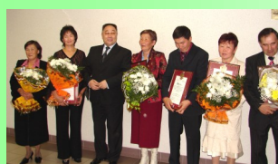
Вручение Гранта "1000000" сентябрь, 2007г. п.Усть-Ордынский